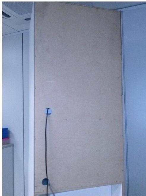
Imagem 02 – vista do fundo