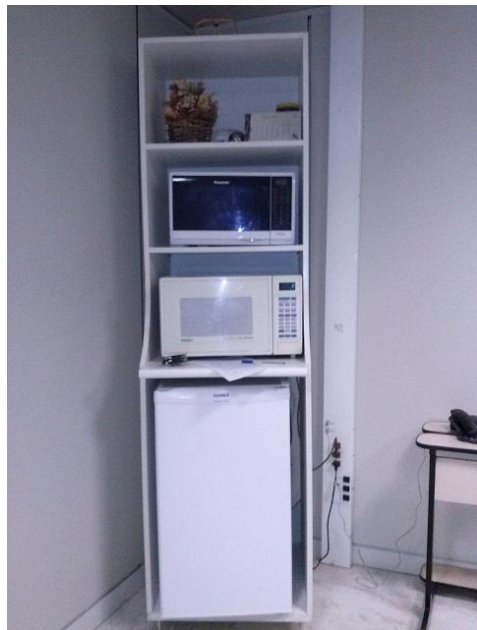
Imagem 01- vista frontal