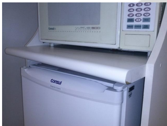
Imagem 03 – prateleira abaulada